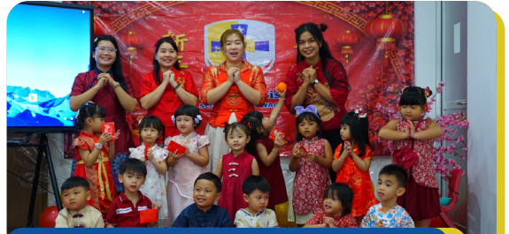
Chinese New Year 2026 Celebration Stella Maris School Karawaci