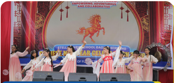
Chinese New Year 2026 Performance Primary Stella Maris School Gading Serpong