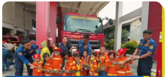
K1 & K2 Field Trip to the Fire Station Sunnyville Preschool & Daycare