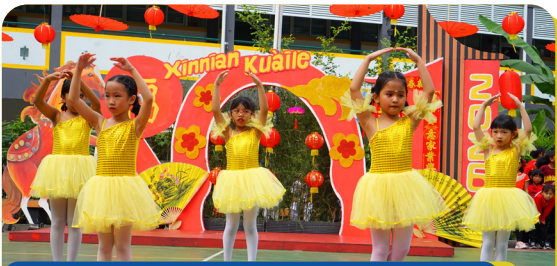
Chinese New Year 2026 Performance Primary Stella Maris School BSD