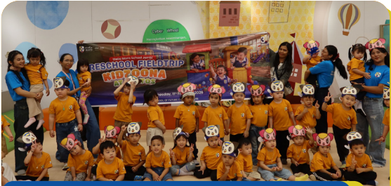
Fieldtrip Stella Maris School Jambi