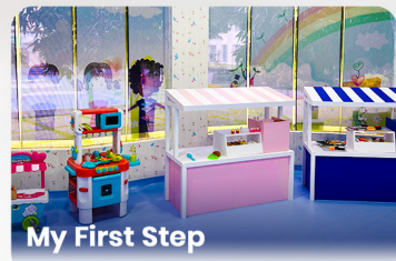
My First Step