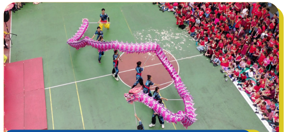
Chinese New Year 2026 Dragon Performance Stella Maris School BSD