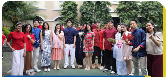
Chinese New Year 2026 Outfit Competition Stella Maris School Gading Serpong