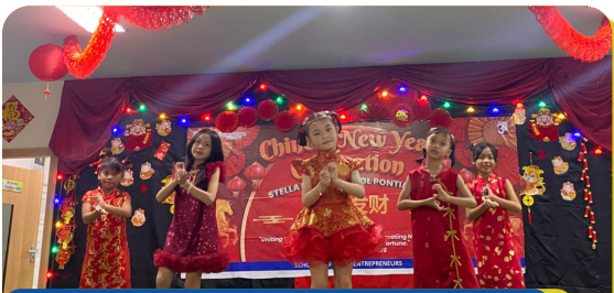
Chinese New Year 2026 Performance Primary Stella Maris School Pontianak