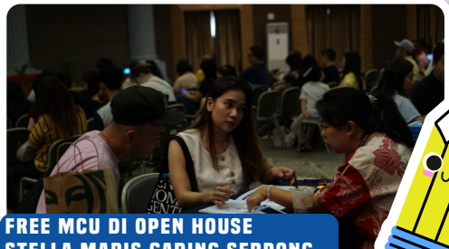
FREE MCU DI OPEN HOUSE STELLA MARIS GADING SERPONG