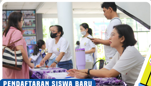
PENDAFTARAN SISWA BARU