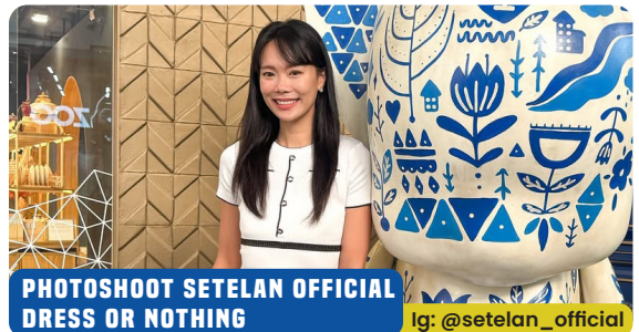
PHOTOSHOOT SETELAN OFFICIAL DRESS OR NOTHING