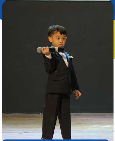
DANIELLO - PERFORMANCE SESSION PUTRA DAN PUTRI STELLA MARIS 2024

“Saya berterima kasih kepada Tuhan dan para guru yang telah membimbing anak-anak dengan penuh dedikasi. Perubahan mereka luar biasa,” ujarnya.