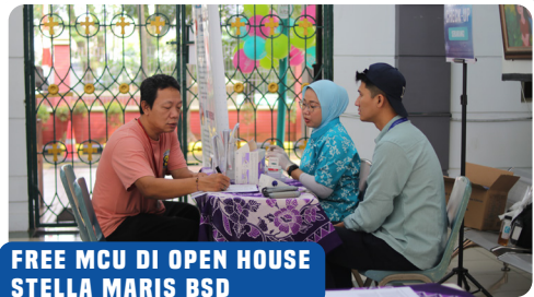
FREE MCU DI OPEN HOUSE STELLA MARIS BSD