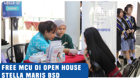
FREE MCU DI OPEN HOUSE STELLA MARIS BSD