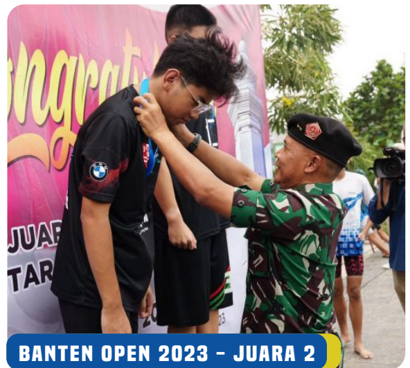
BANTEN OPEN 2023 - JUARA 2

“Gue bangga bisa sekolah di tempat yang ngasih gue kesempatan buat tahu lebih tentang diri sendiri. Buat teman-teman yang pengen kenal potensi kalian, Stella Maris adalah pilihan yang pas,” katanya mantap.