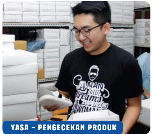
YASA - PENGECEKAN PRODUK