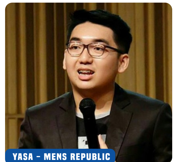
YASA - MENS REPUBLIC