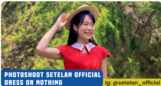
PHOTOSHOOT SETELAN OFFICIAL DRESS OR NOTHING