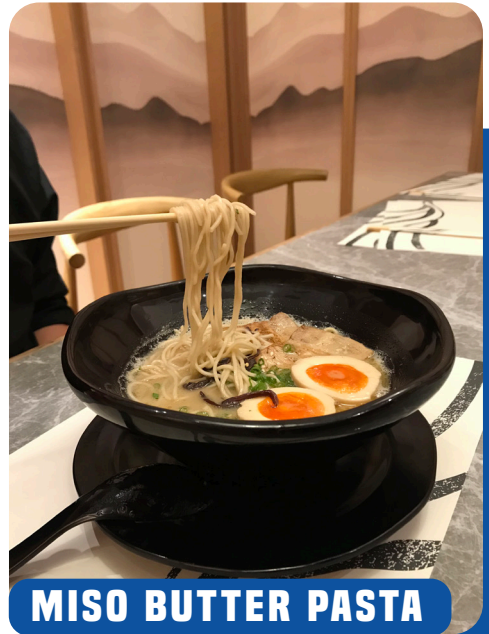
MISO BUTTER PASTA

Sementara itu, lantai dua menghadirkan pengalaman makan khas Jepang yang autentik dari ramen, donburi, hingga gyoza dengan suasana khas ruang Tatami yang nyaman. Kami memilih untuk menikmati makan siang di lantai dua dan mencoba menu andalan mereka: Tonkotsu Ramen, dengan kuah yang direbus selama 13 jam, menghasilkan rasa gurih yang kaya dan memanjakan lidah.