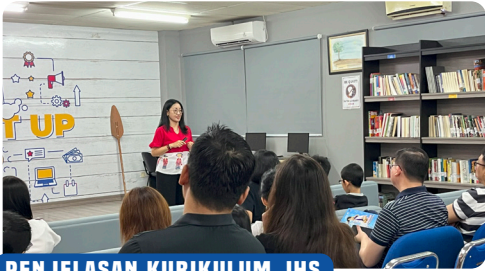
PENJELASAN KURIKULUM JHS