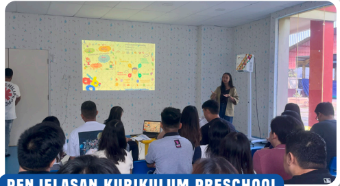
PENJELASAN KURIKULUM PRESCHOOL