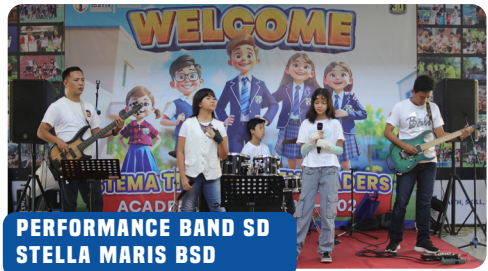
PERFORMANCE BAND SD STELLA MARIS BSD